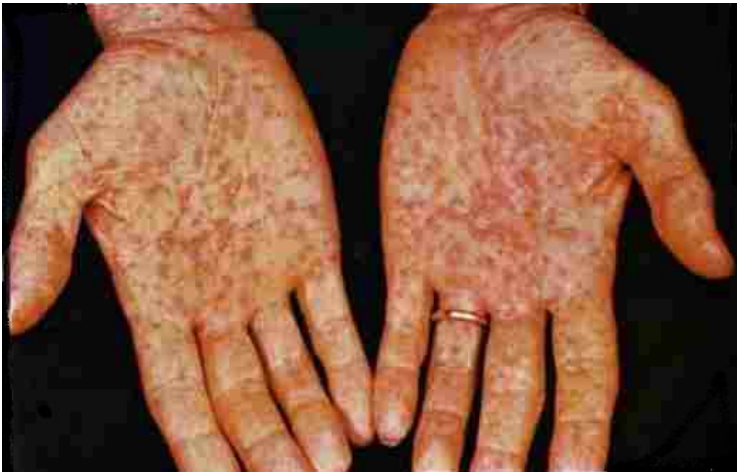
Giang mai thời kỳ II