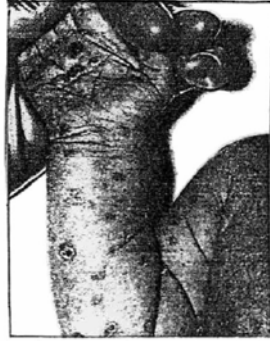
Giang mai bẩm sinh

Khuẩn xoắn Treponema pallidum gây giang mai xâm nhập vào cơ thể xuyên qua lớp màng mỏng của dương vật, âm đạo, hậu môn, mồm, và qua da. Chỉ vài tiếng đồng hồ sau là khuẩn đã có mặt trong máu, gây tác hại cho bệnh nhân và cả bào thai nếu bà mẹ chẳng may nhiễm bệnh, đưa đến hư thai, sinh con chết non, con đẻ ra với một số tật nguyên.